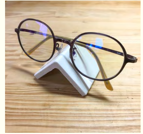
インテリア雑貨としてのタイル