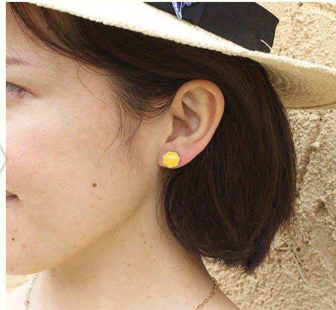
ファッションにおけるタイル芸術