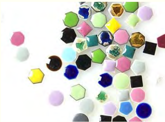
アクセサリとしてのタイル